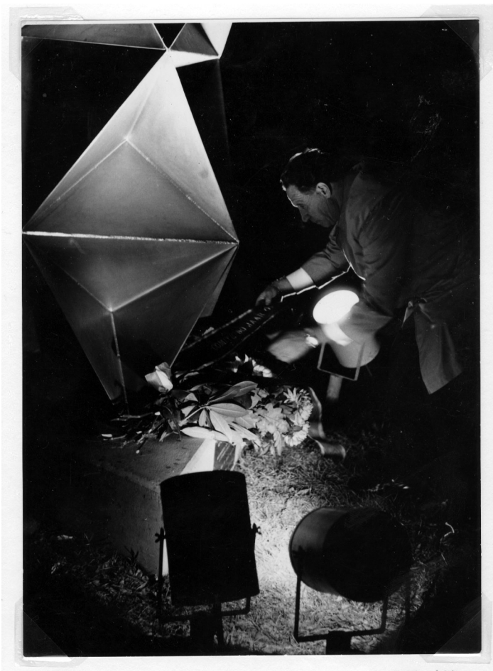
Kranslegging bij het monument in Weidum door de heer van Bakel namens het "Comté 50 jaar Radio"