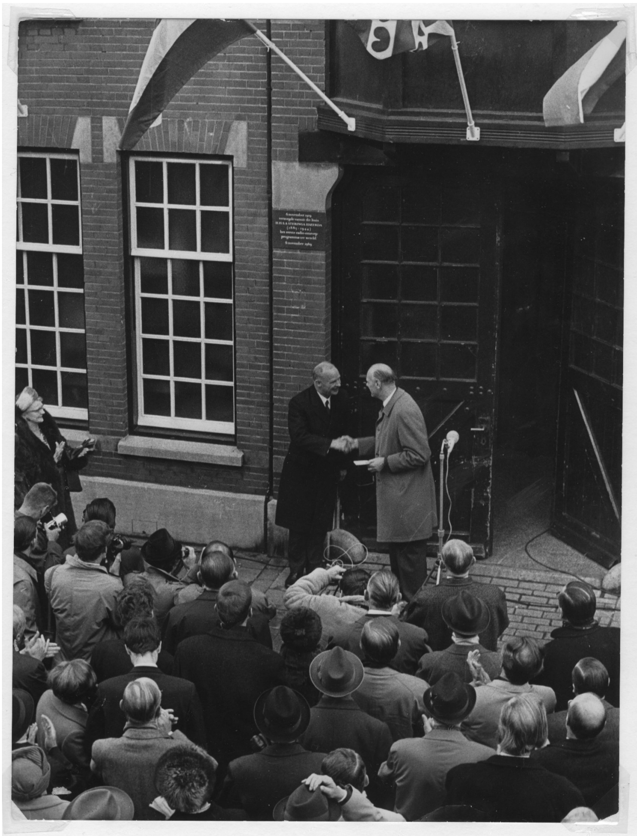
Na de onthulling van de gedenksteen aan de Beukstraat 8 in Den Haag, speelde de Postharmonie het Friese volkslied