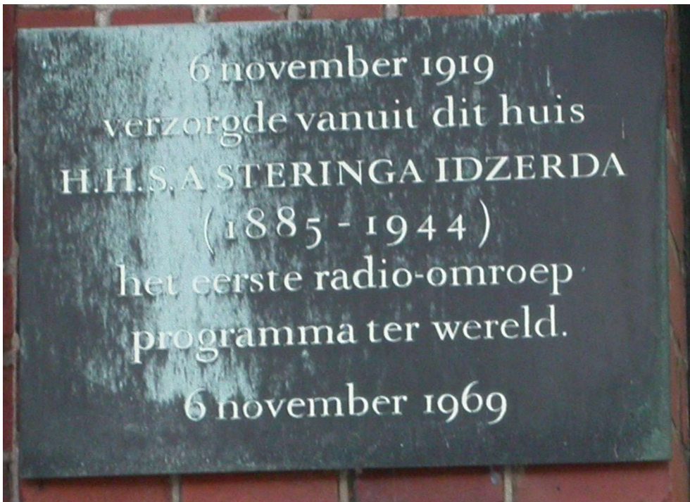
De gedenksteen aan de Beukstraat 8.