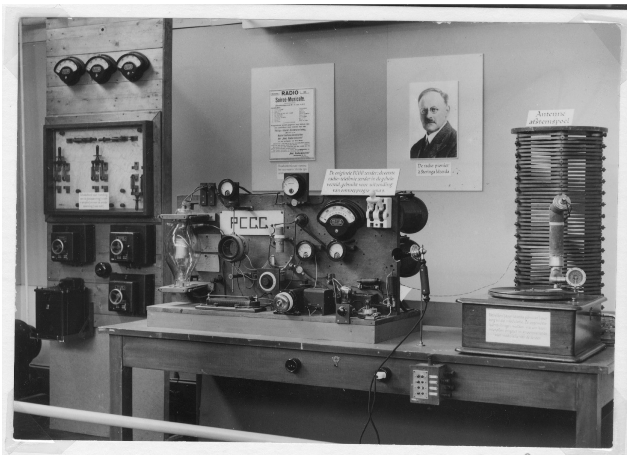
Hier de opstelling in het Postmuseum inclusief schakelkast